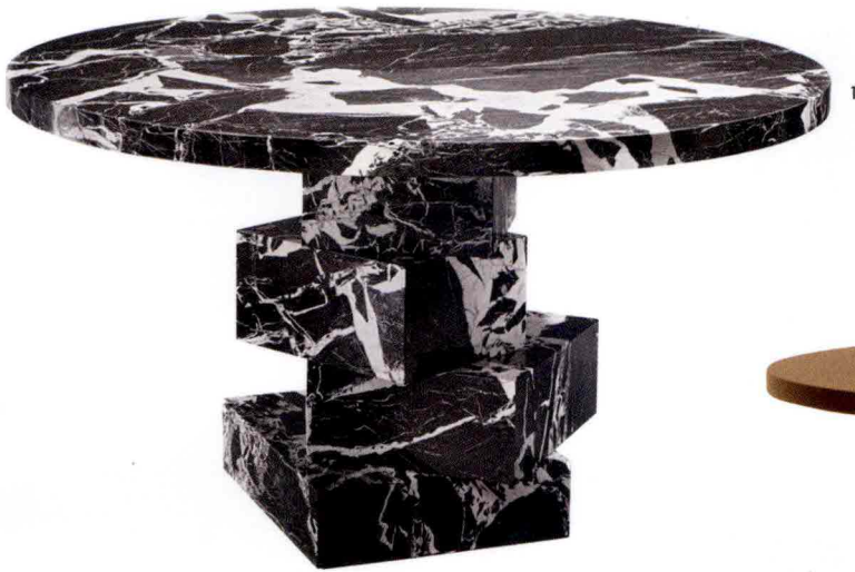
1. Table en marbre Grand Antique. Grand Antique marbre. Maxime 663 , ø130 x h74 cm, HERVÉ VAN DER STRAETEN. 2. Table en chêne teinté et base en céramique. Tinted oak, ceramic base. Figures , design Anthony Guerrée, ø124 x h74 cm, PRADIER-JEAUNEAU. 3. Table en palissandre laqué et laiton satiné, plateau en verre fusionné. Lacquered palisander, satin-finish brass and fused glass. Loom , design Christophe Delcourt, ø180 x h77 cm, BAXTER. 4. Table en verre recyclé. Recycled glass. Babar , design Patricia Urquiola, ø130 x h73 cm, GLAS ITALIA. 5. Table en chêne brossé et métal. Brushed oak and metal. Camma , design Marie-Christine Dorner, ø1160 x h74 cm, LIGNE ROSET.