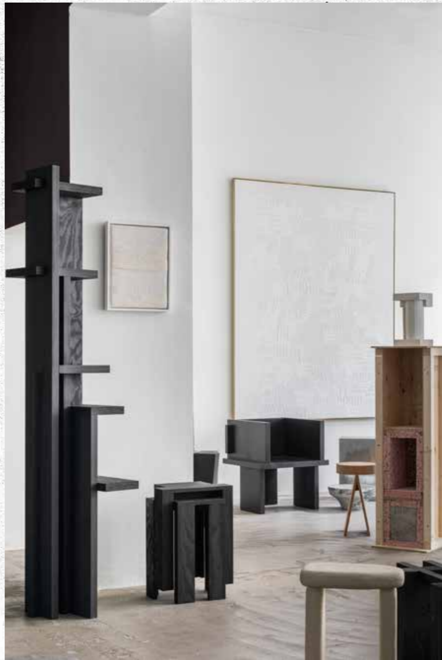
ATELIER ECRU, GENT