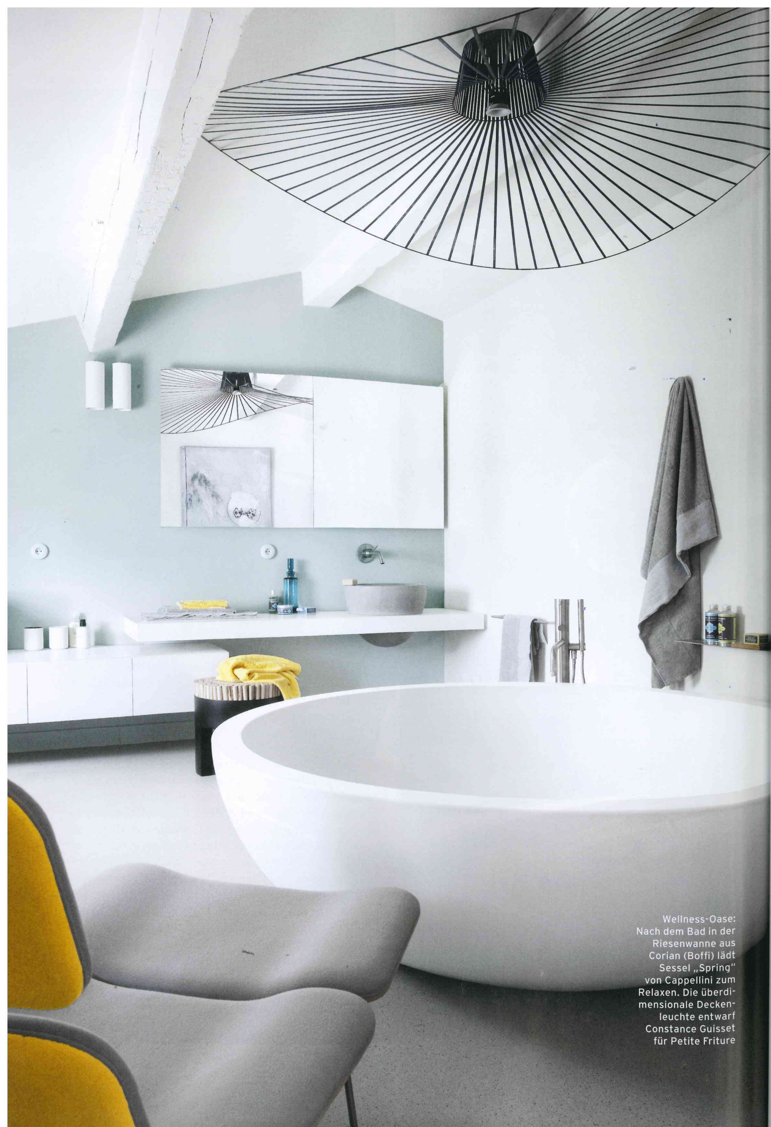
Wellness-Oase: Nach dem Bad in der Riesenwanne aus Corian (Boffi) lädt Sessel „Spring“ von Cappellini zum Relaxen. Die überdi- mensionale Decken- leuchte entwarf Constance Guisset für Petite Friture