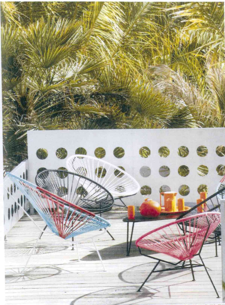
LINKS: Auf dem Sonnendeck - in den 50ern in Mexiko entworfen, möbeln die runden Outdoor-Sessel „Luisa“ und „Maria“ (Mama Silla) den Loungebereich am Pool auf. UNTEN: Palmen und Zypressen säumen das neu gestaltete Becken. Das Lochmuster in der Metallumrahmung der Sonnenterrasse - dezenter Sicht- und Windschutz - findet sich auch bei der Eingangstür des Hauses wieder