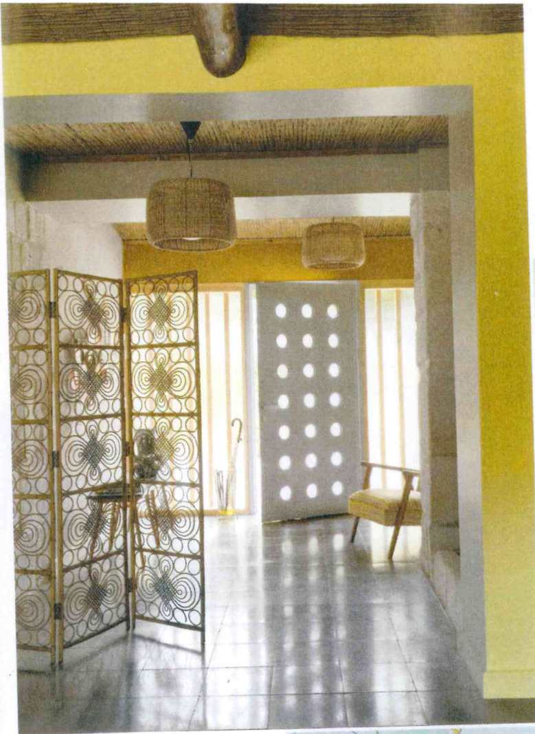
LINKS: Passend zur Großzügigkeit des Hauses erweiterte Gérard Faivre den Eingangsbereich. Die Metalltür mit Kreis- motiven ist sein Eigenentwurf. Terrazzofliesen zieren im ganzen Haus die Böden. LINKS UNTEN: Als Kontrapunkt zu den klaren Linien der Küche speist man auf Geschirr im fröhlichen Mustermix. UNTEN: Von wegen Landhausküche! Mit Fronten in Hellblau passt sich die maßgefertigte Küche von Arclinea dem Vintage-Flair des Hauses an